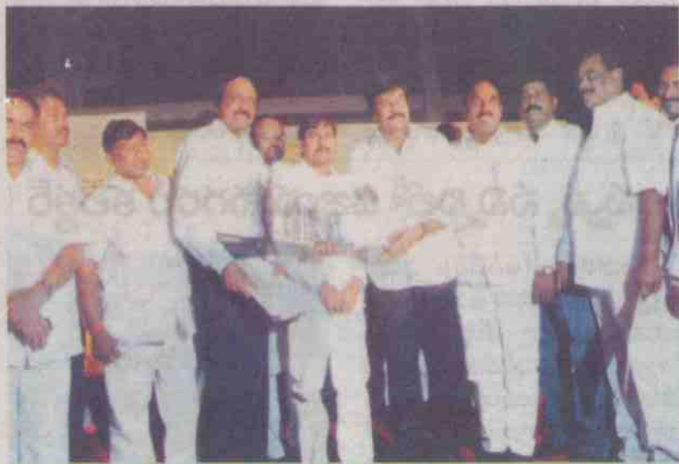
లోదానీను ఆవిష్కరిస్తున్న ప్రజారాజ్యం పార్టీ అధినేత చిరంజీవి

విశాఖపట్నం (ఆన్ లైన్): ఓంకాన్ ఇన్ ఫ్రాస్ట్రక్చర్స్ మధురవాడలో ట్రాయ్ బాట్ షోరూమ్ కు ఎదురుగా ఫ్లాన్ చేసిన 'రెయిన్ ఫారెస్ట్' గేటెడ్ కమ్యూనిటీ రెసిడెన్షియల్ ఏరియాలో అందరికీ అందుబాటు ధరల్లో గృహాలు నిర్మిస్తామని ఆ కంపెనీ మేనే